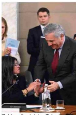
Zakia e il ministro Tajani

L'iniziativa è stata promossa dalla Fondazione Mama Sofia. E il governo promette maggiori risorse alla Farnesina